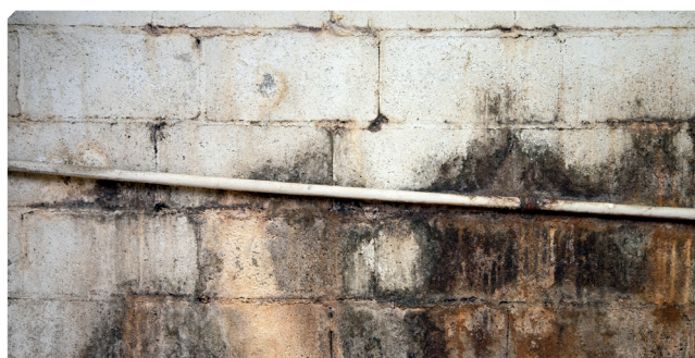
■ Umidità e microrganismi sopra il supporto