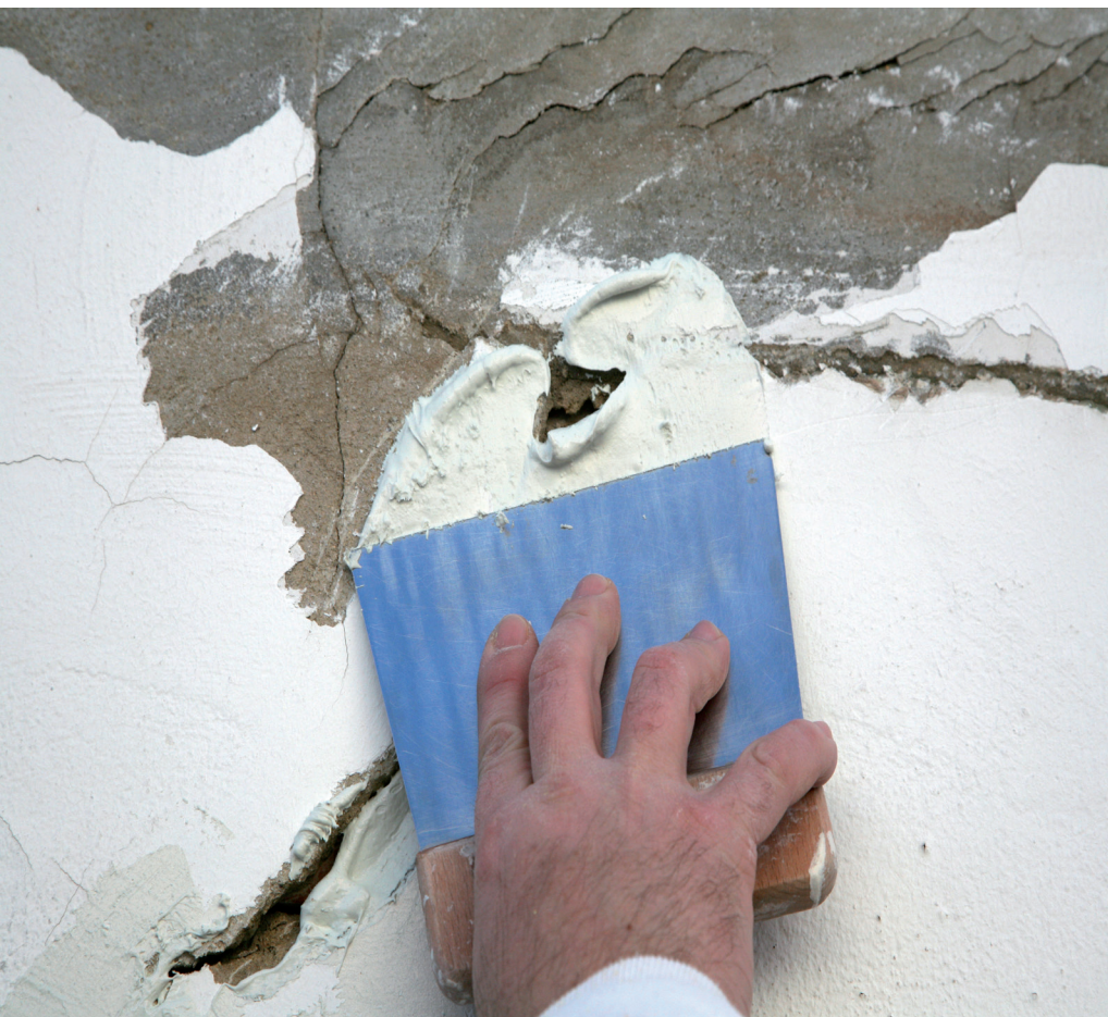
Riempimento di crepe sul fondo di gesso o pittura tradizionale.