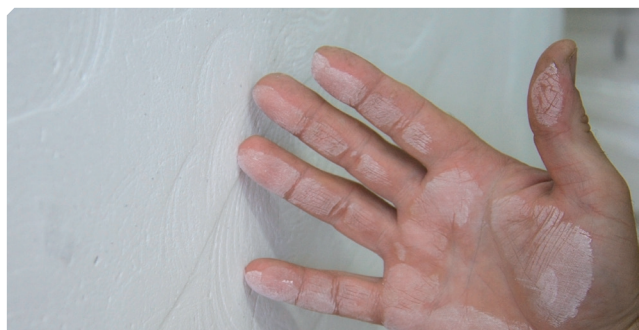
■ Supporto polveroso