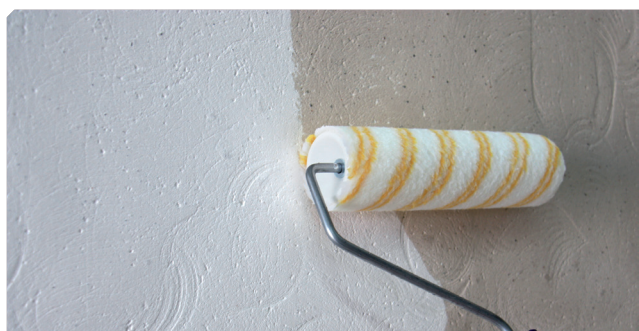
■ Imprimitura del supporto con il consolidante all'alcool