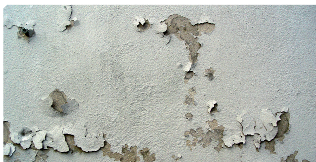
■ Vecchio fondo mal aderito