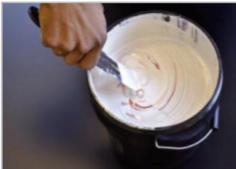
Fase 3 - Miscelare bene il prodotto