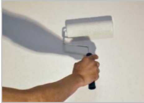
Fase 1 - Applicazione Primus Sabbia

Conservare in luogo fresco e asciutto al riparo dall'umidità e dal gelo.