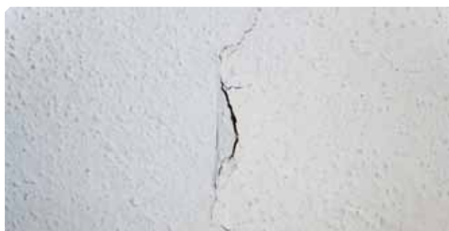
■ Cavità di supporto debole