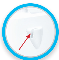
Porta ampolla integrato