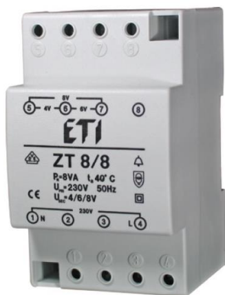
Immagine dei prodotti / Products images