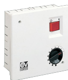
SCNRB SCAT.COM.NON REV.INCASSO Codice 12971