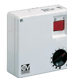
C 1.5 (COMANDO EL. 1.5 A) Codice 12966