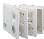
KIT SCB (TRASF.E.C.) Codice 22481