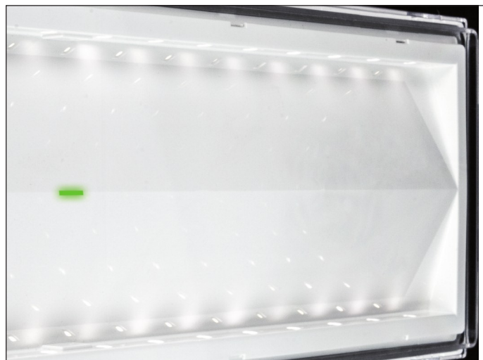
RIFLETORE CUNEIFORME A DOPPIA RIFLESSIONE CON LED DI SEGNALAZIONE