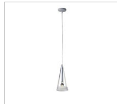
Fucsia 1 design by Achille Castiglioni