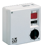
SCNRL5 UNIF. X NK SOFFITTO