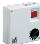
SCNR/M SCAT.COM. NON REV. MULT.