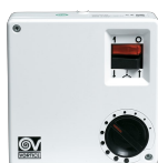
SCNR5 UNIF.X NK SOFFITTO