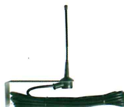
ACG5450 ANTENNA 433 con cavo per applicazione a muro