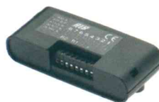
ACG5084 Ricevitore S433 2CH, bicanale, con morsetti, con contenitore plastico Dim. 125x54x30