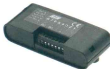
ACG5086 Ricevitore S433 4CH, quadricanale, con morsetti, con contenitore plastico Dim. 125x54x30