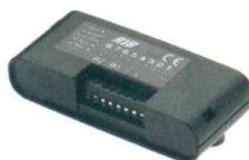
ACG5082 Ricevitore S433 1CH, monocanale, con morsetti, con contenitore plastico Dim. 125x54x30