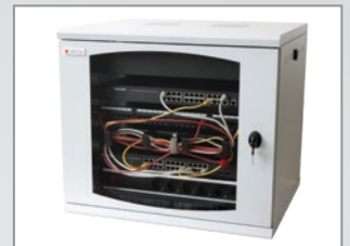
Esempio di Applicazione