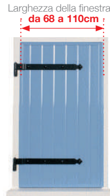
Una tapparella a 1 anta singola sinistra , peso massimo 30 kg