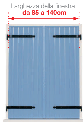
Una tapparella a 2 battenti , peso massimo 30 kg per battente