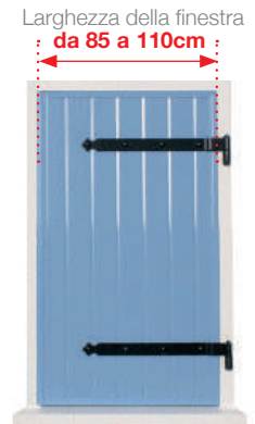
Una tapparella a 1 anta singola destra , peso massimo 30 kg