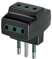
00320 - Adattatore mult. S11+3P11 nero