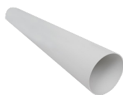
TUBO PVC D.100 L=700 (HRW 30) Codice 21879