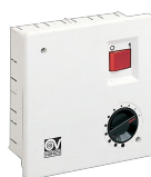
SCNRB SCAT.COM.NON REV.INCASSO Codice 12971