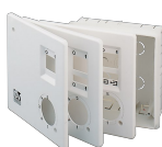
KIT SCB (TRASF.E.C.) Codice 22481