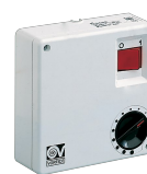
C 1.5 (COMANDO EL. 1.5 A) Codice 12966