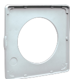
S 150/6 Codice 22156