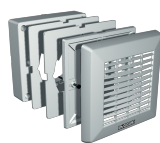
F 150/6" Codice 22133