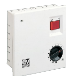
SCNRB SCAT.COM.NON REV.INCASSO Codice 12971