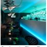
Stefano's Fine Food Restaurant