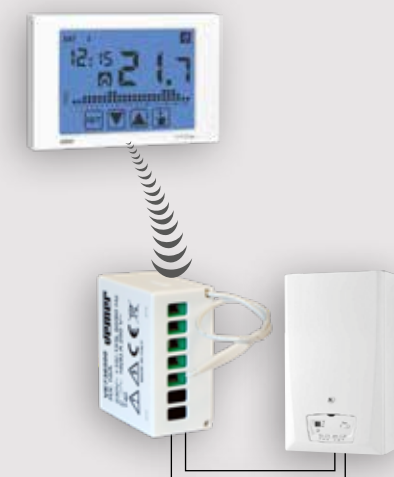
Esempio di collegamento con un attuatore remoto a 1 canale