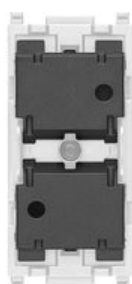
14594.0 - Meccanismo tapparella connesso IoT