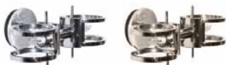
cromo cod 605